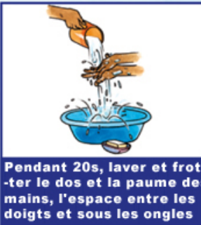
Pendant 20s, laver et frotter le dos et la paume des mains, l'espace entre les doigts et sous les ongles