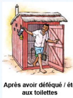
Après avoir déféqué / été aux toilettes