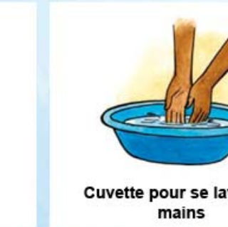
Cuvette pour se laver les mains