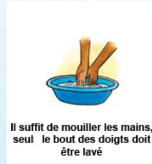
Il suffit de mouiller les mains, seul le bout des doigts doit être lavé