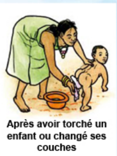
Après avoir torché un enfant ou changé ses couches