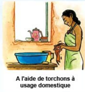
A l'aide de torchons à usage domestique