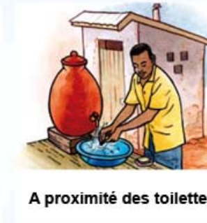
A proximité des toilettes