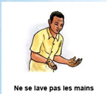
Ne se lave pas les mains