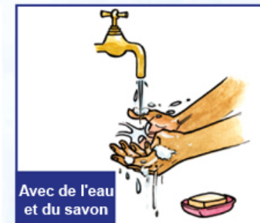
Avec de l'eau et du savon