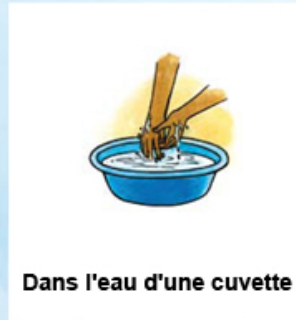
Dans l'eau d'une cuvette