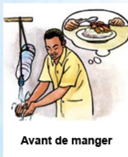
Avant de manger