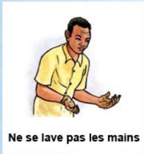
Ne se lave pas les mains