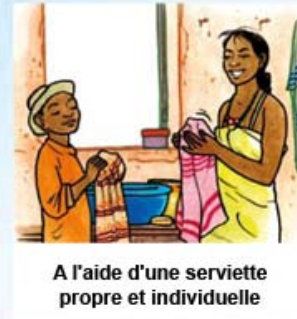
A l'aide d'une serviette propre et individuelle