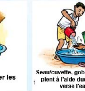
Seau/cuvette, gobelet ou autre récipient à l'aide duquel on puise et verse l'eau, savon