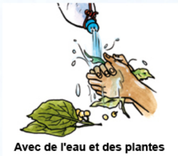
Avec de l'eau et des plantes