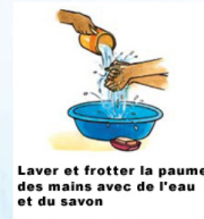
Laver et frotter la paume des mains avec de l'eau et du savon