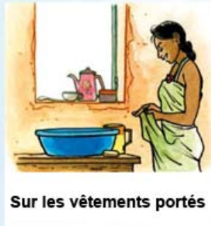
Sur les vêtements portés