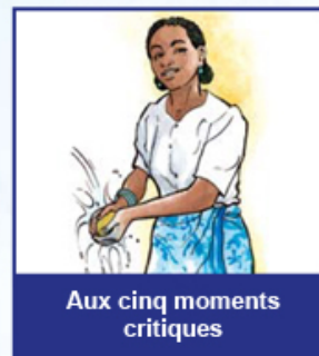
Aux cinq moments critiques