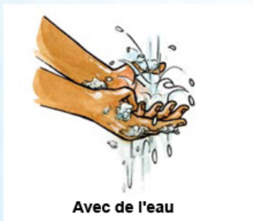
Avec de l'eau