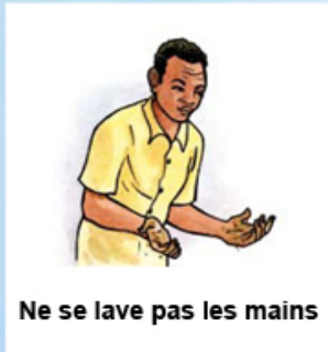
Ne se lave pas les mains