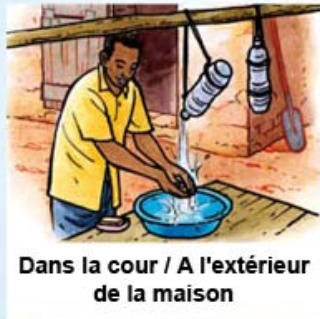
Dans la cour / A l'extérieur de la maison