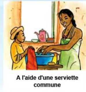
A l'aide d'une serviette commune