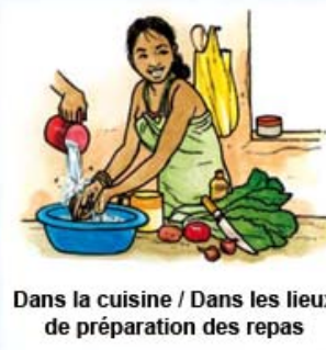
Dans la cuisine / Dans les lieux de préparation des repas