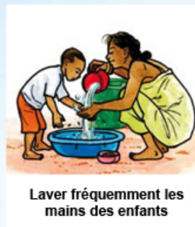
Laver fréquemment les mains des enfants