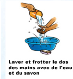
Laver et frotter le dos des mains avec de l'eau et du savon