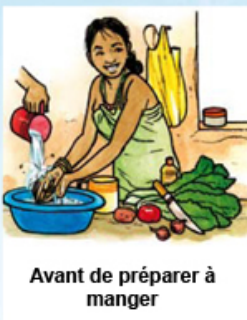
Avant de préparer à manger