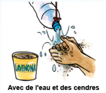
Avec de l'eau et des cendres