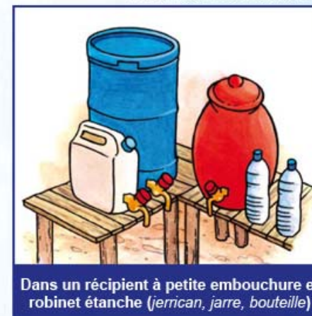
Dans un récipient à petite embouchure et robinet étanche (jerrycan, jarre, bouteille)