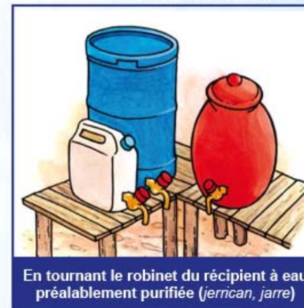
En tournant le robinet du récipient à eau préalablement purifiée (jerrycan, jarre)