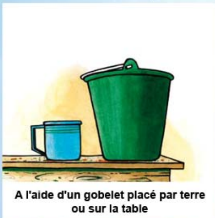
A l'aide d'un gobelet placé par terre ou sur la table