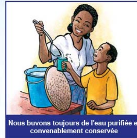
Nous buvons toujours de l'eau purifiée et convenablement conservée