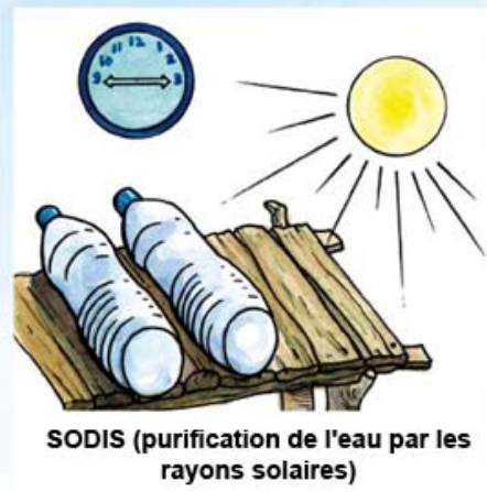
SODIS (purification de l'eau par les rayons solaires)