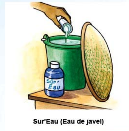
Sur'Eau (Eau de javel)