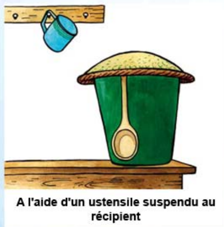
A l'aide d'un ustensile suspendu au récipient