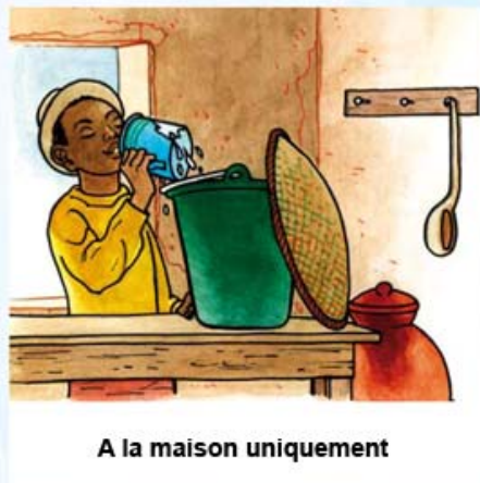
A la maison uniquement