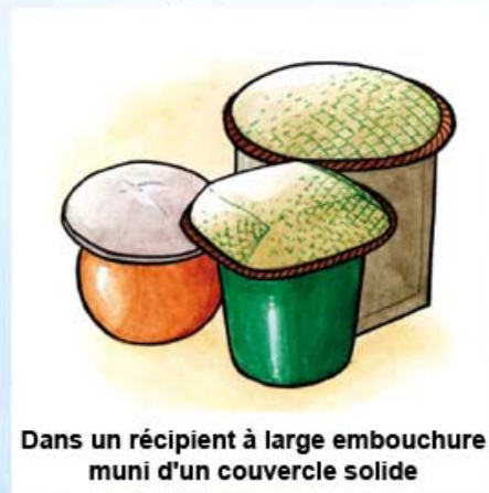
Dans un récipient à large embouchure muni d'un couvercle solide