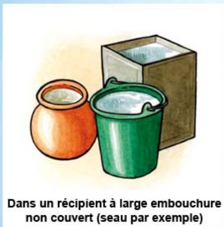
Dans un récipient à large embouchure non couvert (seau par exemple)