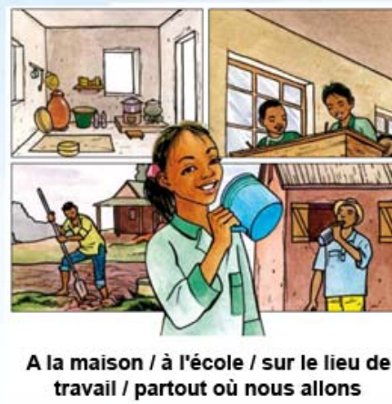
A la maison / à l'école / sur le lieu de travail / partout où nous allons