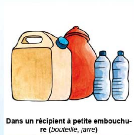
Dans un récipient à petite embouchure (bouteille, jarre)