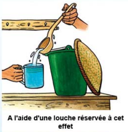
A l'aide d'une louche réservée à cet effet